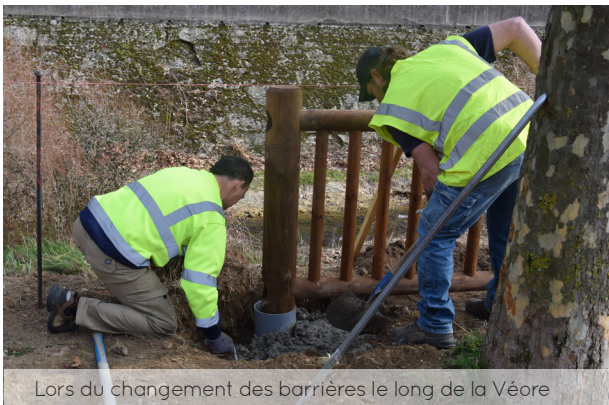
Lors du changement des barrières le long de la Véore

La voirie est un volet très coûteux et les besoins sont importants sur le territoire communal, or la municipalité ne peut pas tout réaliser d'un coup. C'est pourquoi, depuis le début du mandat, les élus ont décidé d'allouer une enveloppe importante chaque année pour les travaux de rénovation de voirie : 240 000€ en 2022, 501 900€ en 2023 et 616 580€ en 2024.