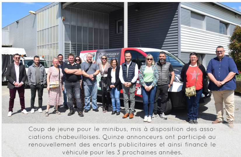
Coup de jeune pour le minibus, mis à disposition des associations chabeuilloises. Quinze annonceurs ont participé au renouvellement des encarts publicitaires et ainsi financé le véhicule pour les 3 prochaines années.

N'hésitez pas à venir rencontrer tout ce beau monde, le vendredi 6 septembre à partir de 15h30 et jusqu'à 20 heures, au Centre culturel et sur les pelouses alentours. Démonstrations et food-trucks seront de la partie pour un forum en forme !