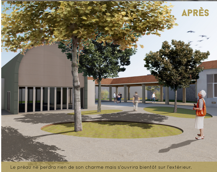
Le préau ne perdra rien de son charme mais s'ouvrira bientôt sur l'extérieur.