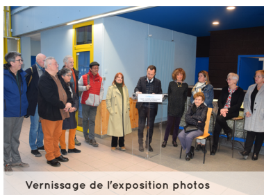
Vernissage de l'exposition photos

Attention, seuls les mails comportant : âge, adresse, numéro de téléphone et personnage féminin inspirant seront conservés en vue d'une éventuelle participation. Merci de votre compréhension.