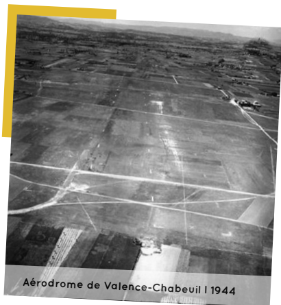
Aérodrome de Valence-Chabeuil | 1944