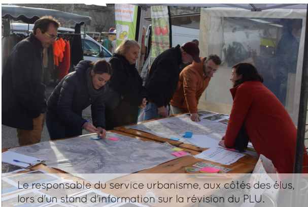
Le responsable du service urbanisme, aux côtés des élus, lors d'un stand d'information sur la révision du PLU.

A l'échelle d'une ville, les enjeux en termes d'urbanisme sont relativement importants. Il s'agit avant tout de maîtriser le développement urbain et trouver le juste équilibre entre croissance économique, construction de logements et préservation de l'environnement.