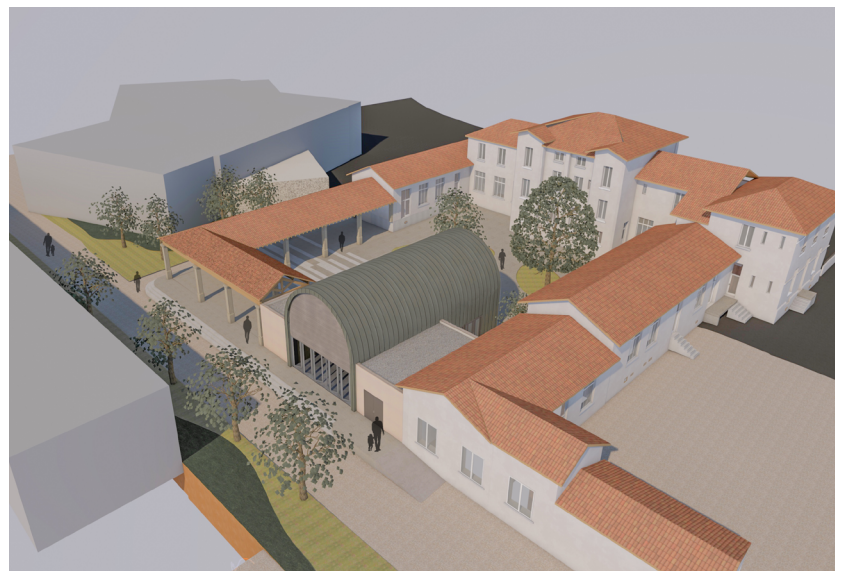
Voilà à quoi va ressembler le nouvel espace autour de Cuminal