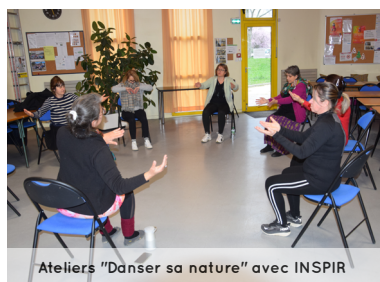
Ateliers "Danser sa nature" avec INSPIR