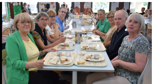
En fin d'année les bénévoles de Lire et faire lire ont mangé à la cantine.