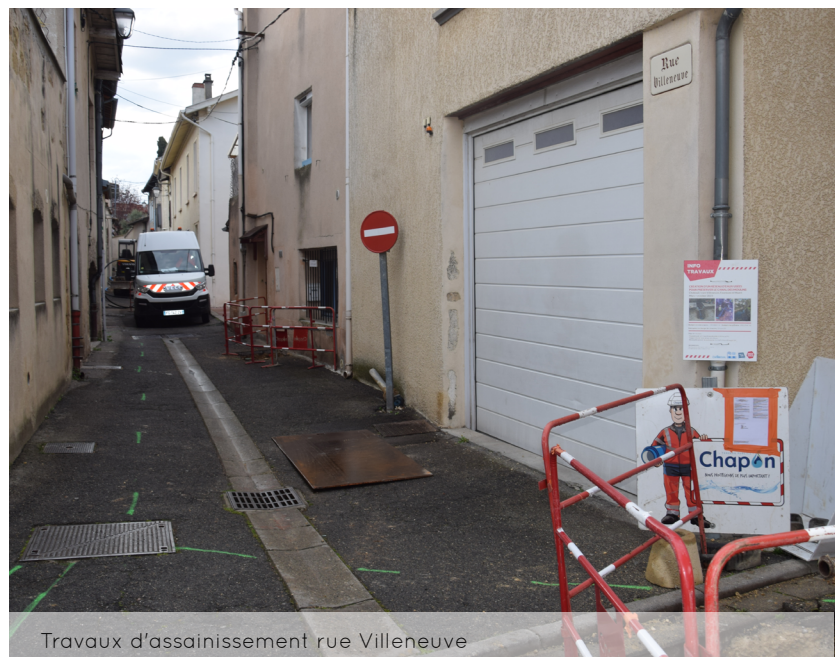
Travaux d’assainissement rue Villeneuve