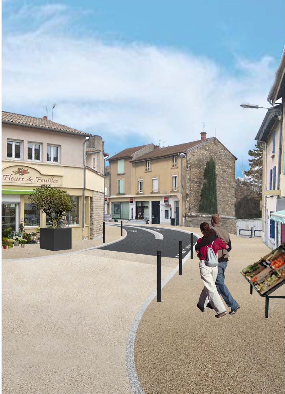
Voilà à quoi va ressembler le Faubourg de l'Hôpital en octobre ! Projection réalisée par le Cabinet David

Pour tout savoir sur les travaux et la fermeture du Faubourg de l'Hôpital, rendez-vous le 26 juillet au centre culturel à 18 heures.